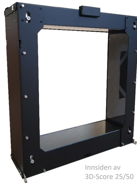
Innsiden av 3D-Score 25/50