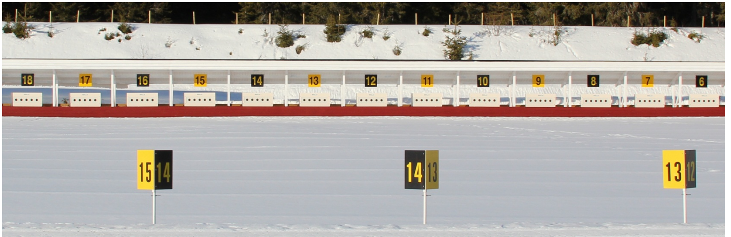
Bilde: MjøsSki, Brumunddal. 30 BIA1200 i system.