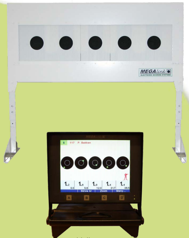
Umiddelbar anvisning på monitor

Kontakt Megalink på 64 93 34 12 eller salg@megalink.no for mer informasjon.